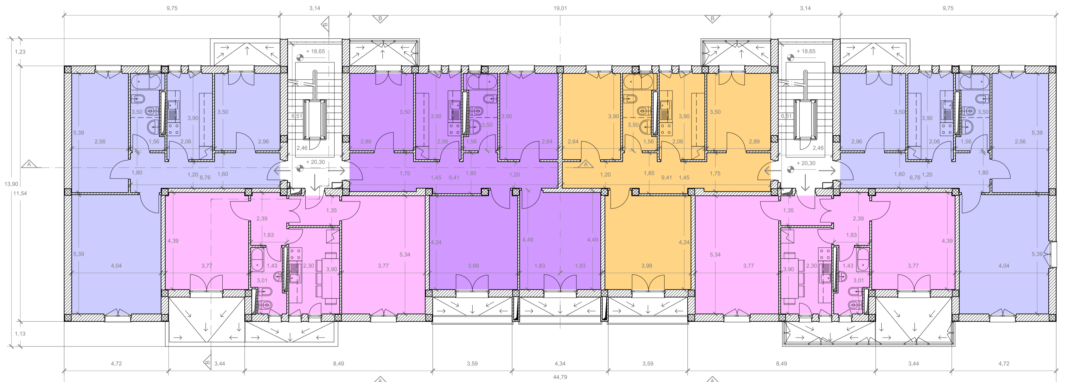
Pianta piano tipo (piano 1) a quota + 20.30, scala 1:100