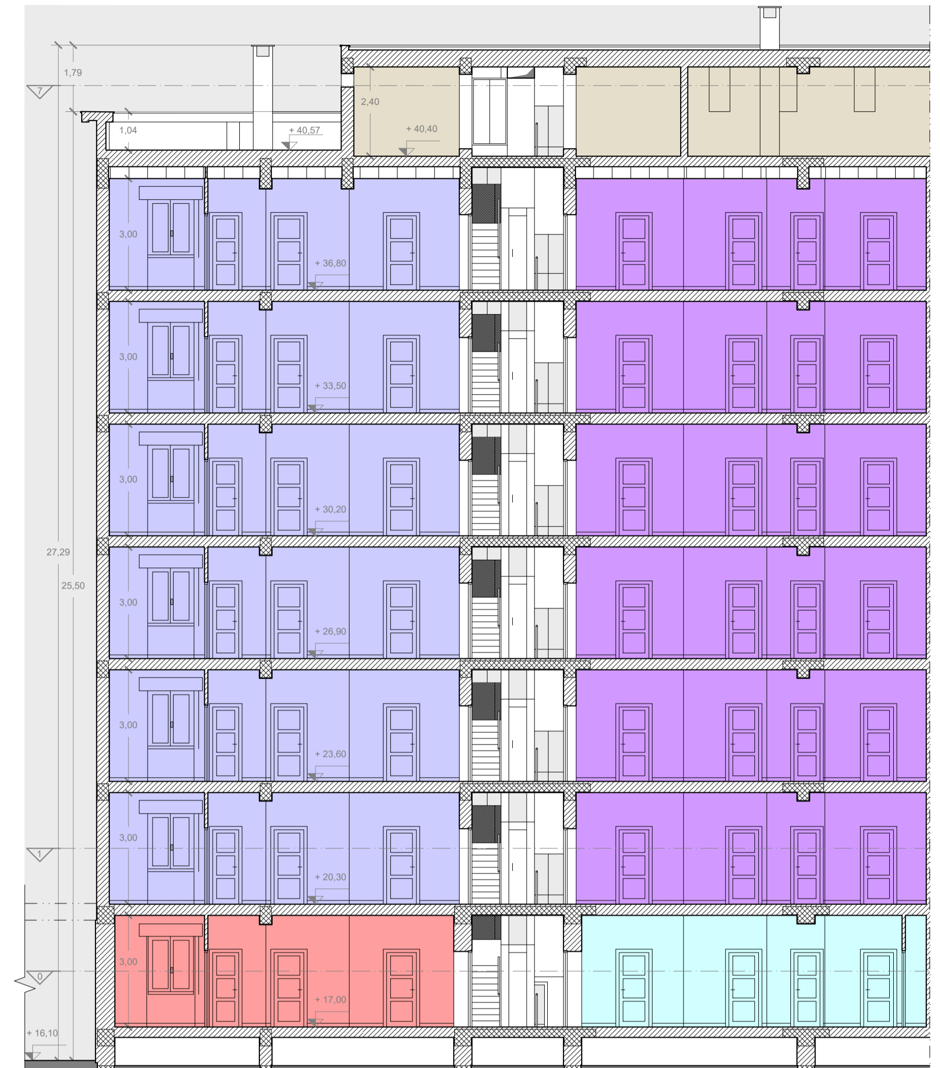
Semisezione longitudinale A-A, scala 1:100